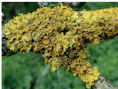
Porost złotorost ścienny

W trakcie wędrowki, w środku dzikiego lasu, zasiedlonego przez różnorodne gatunki roślin i zwierząt, napotkamy dwa obiekty, które nie powstałyby bez udziału człowieka – Groty Mirachowskie (twór utworzony w sposób półnaturalny) i bunkier „Ptasia Wola”. Wpisały się one w tutejszy krajobraz i są pamiątką historyczną tego terenu.