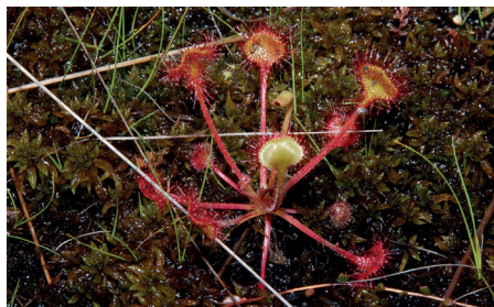
Rosiczka okrągłolistna

W trakcie wędrowki znajdziesz wiele różnych gatunków roślin; niektóre z nich, choć małe i niepozorne, mają wiele uroku, jeśli przyjrzymy im się z bliska. Inne pięknie kwitną i już z daleka rzucają się w oczy. Czy chciałbyś nauczyć się je rozpoznawać i nazywać? Pomoże Ci w tym jedna z bezpłatnych aplikacji, którą można ściągnąć na telefon komórkowy, np. Pl@nt Net. Wystarczy zrobić zdjęcie roślinie, a aplikacja powie Ci, jaki to gatunek. Stwórz sobie w telefonie atlas roślin z wycieczki.